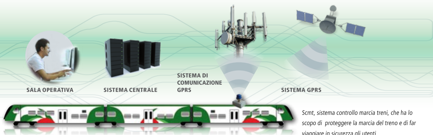
Scmt, sistema controllo marcia treni, che ha lo scopo di proteggere la marcia del treno e di far viaggiare in sicurezza gli utenti

L'Scmt (Sistema controllo marcia treni) è un dispositivo tecnologico che ha lo scopo di proteggere la marcia del treno e, quindi, di far viaggiare gli utenti in una condizione di sicurezza. La velocità massima consentita viene controllata istante per istante, così come vengono costantemente monitorati i segnali che regolano la circolazione. E ciò non solo in condizioni di normalità del viaggio, ma anche in quelle perturbate. Infatti, in caso